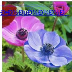
Д»Д 1/2 ДμД 1/4 Д 3/4 Д 1/4 Д