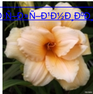
Д°Ї-Д»Ї-Д 1/2 Д, Д°Д