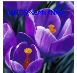
Д°ЇЄД 3/4 Д°Ї/Ї•Д